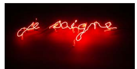
Claude Levêque, Je saigne , 2014.