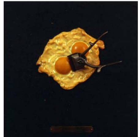
Daniel Spoerri et Robert Filliou, Tondre un œuf , 1964.

• Le processus de recupération d'objets participe d'une démarche de recyclage et contribue à donner une nouvelle vie à ces objets. Réalisés à partir de bidons d'huile, les masques de Romuald Hazoumé jouent des qualités plastiques de l'objet jetable – ses reliefs et ses cavités évoquent ceux d'un visage – pour créer une sorte de tête de poupée vaudou. Détourné de sa fonction d'usage, l'objet devient inutilisable et acquiert une plus-value artistique.