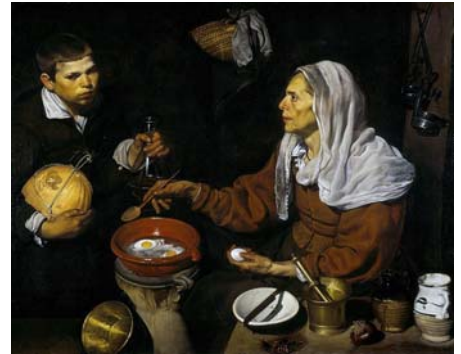
Diego Velasquez, Vieille femme faisant frire des œufs , 1618, National Gallery of Scotland.