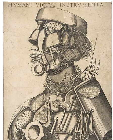
Proche d'Arcimboldo, Instruments de la subsistance humaine , détail, après 1569, Met Museum.