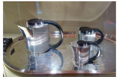
Service à thé Puiforcat, années 1930.