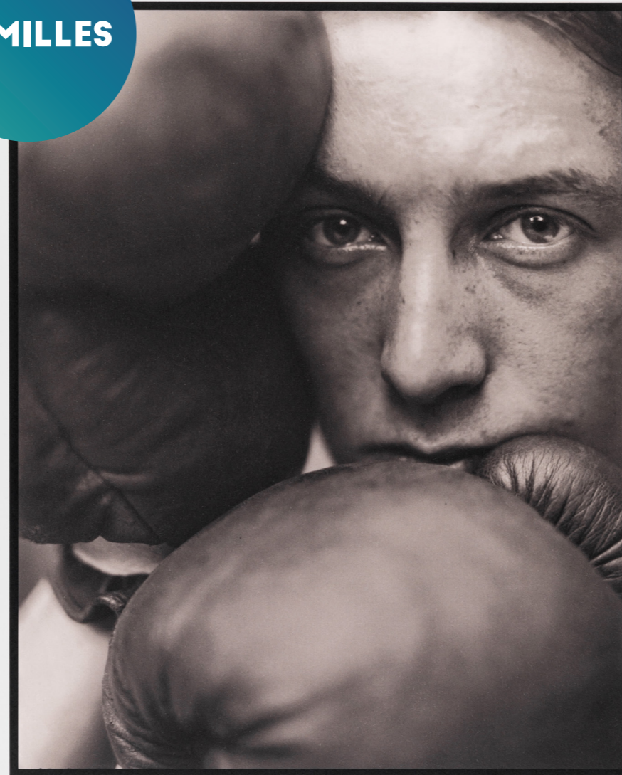
Pierre Dubreuil, The First Round , vers 1932