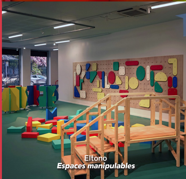
Eltono Espaces manipulables