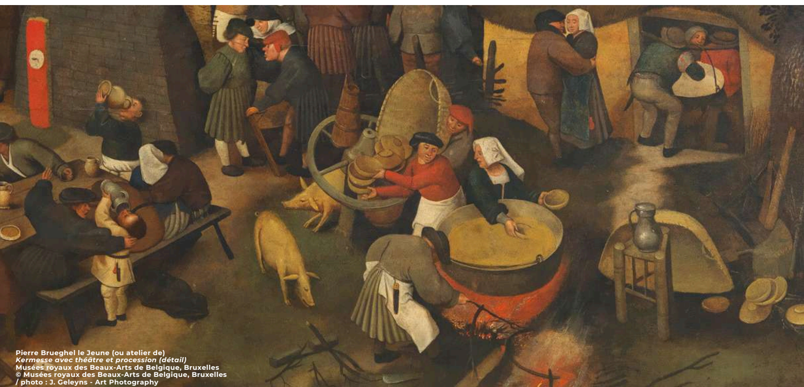
Pierre Brueghel le Jeune (ou atelier de) Kermesse avec théâtre et procession (détail) Musées royaux des Beaux-Arts de Belgique, Bruxelles

Blaise Ducos, hoofdconservator, verantwoordelijke van de Vlaamse en Nederlandse schilderijen in het Louvre en Sabine van Sprang, conservatrice van de Vlaamse schilderkunst 1550-1650 in de Koninklijke Musea voor Schone Kunsten van België, wetenschappelijke commissarissen van de tentoonstelling.