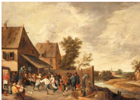
Thomas van Apshoven Fête de village avec joueur de cornemuse sur un tonneau Milieu du XVII e siècle Lille, Palais des Beaux-Arts