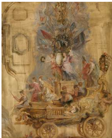
Pierre Paul Rubens Char de triomphe de Kallo Musée royal des Beaux-Arts d'Anvers