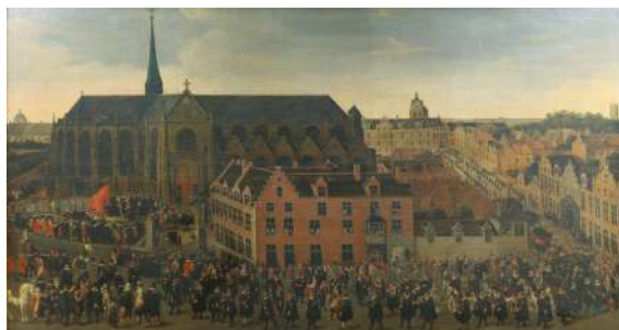
Antoon Sallaert (et atelier) L'infante Isabelle abattant l'oiseau au tir de la corporation des Arbalétriers de Notre-Dame, le 15 mai 1615 au Sablon à Bruxelles Musées royaux des Beaux-Arts de Belgique, Bruxelles