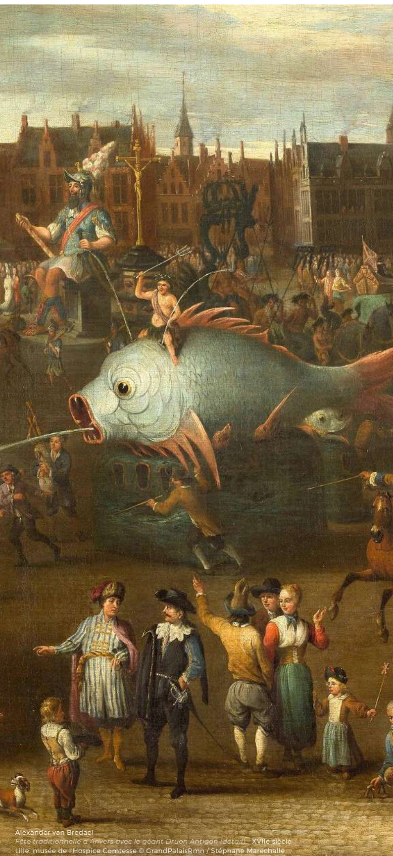
Alexander van Bredael Fête traditionnelle à Anvers avec le géant Druon Antigon (détail) - XVIIe siècle Lille, musée de l'Hospice Comtesse.