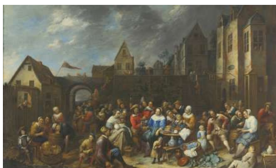
Gillis van Tilborgh Fête villageoise Musées royaux des Beaux-Arts de Belgique, Bruxelles