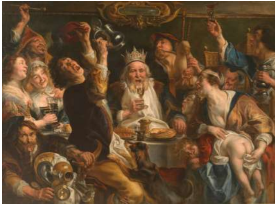
Jacques Jordaens Le roi boit Musées royaux des Beaux-Arts de Belgique, Bruxelles