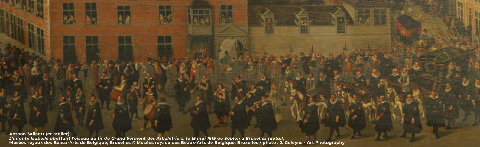
Antoon Sallaert (et atelier) L'infante Isabelle abattant l'oiseau au tir du Grand Serment des Arbalétriers, le 15 mai 1615 au Sablon à Bruxelles (détail) Musées royaux des Beaux-Arts de Belgique, Bruxelles