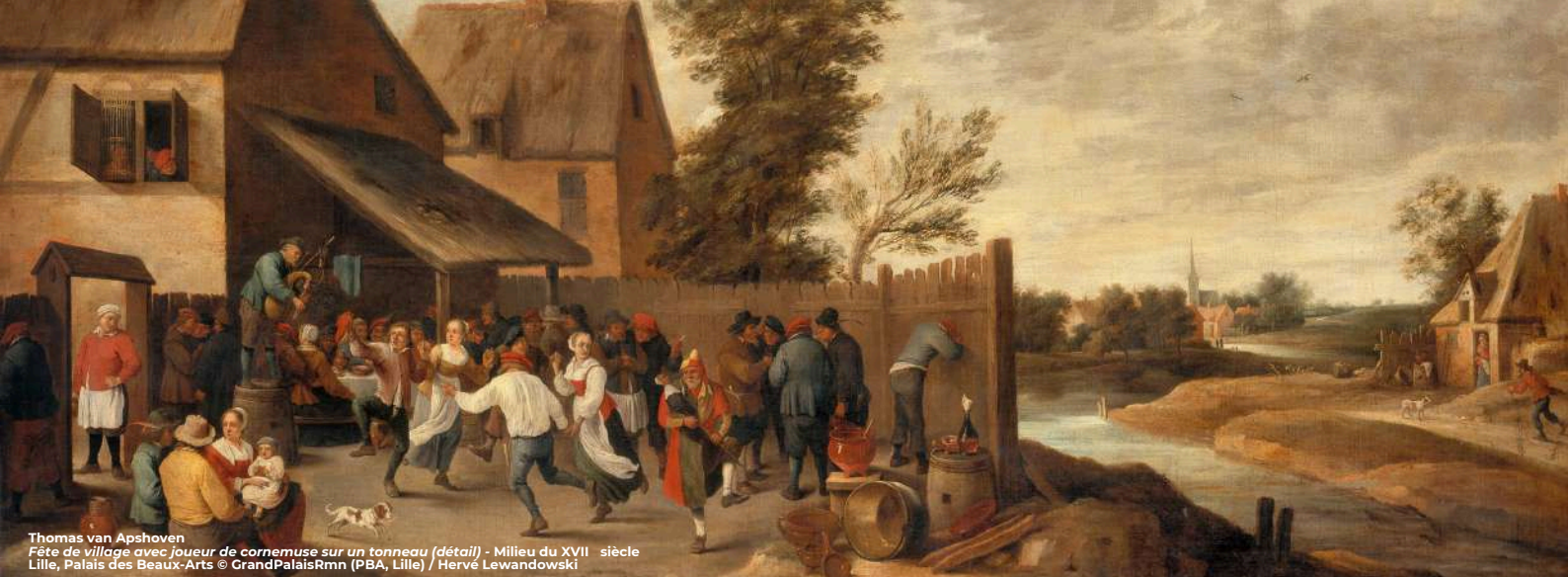
Thomas van Apshoven Fête de village avec joueur de cornemuse sur un tonneau (détail) - Milieu du XVII e siècle Lille, Palais des Beaux-Arts