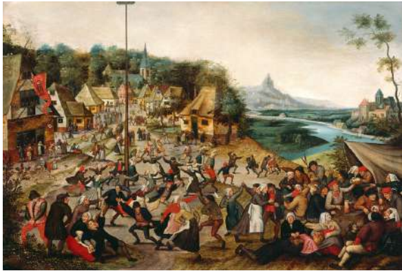
Pieter II Brueghel (Bruxelles, 1564 — Anvers, 1638) Arbre de mai MAH Musée d'art et d'histoire, Ville de Genève.