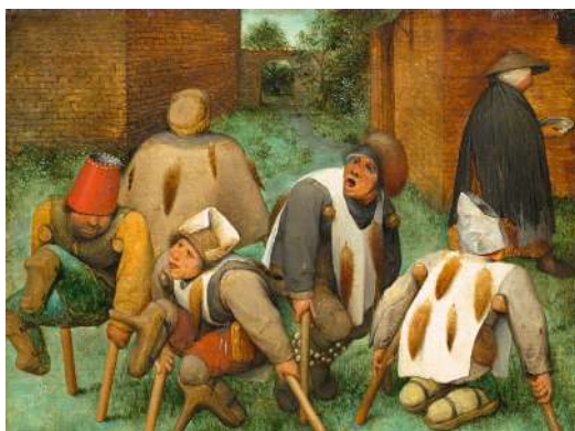
Pierre Bruegel l'Ancien Les Mendiants 1568 Paris, musée du Louvre