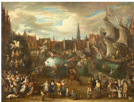
Alexander van Bredael Ommegang avec le géant Druon Antigone sur le Meir 1697 Lille, musée de l'Hospice Comtesse