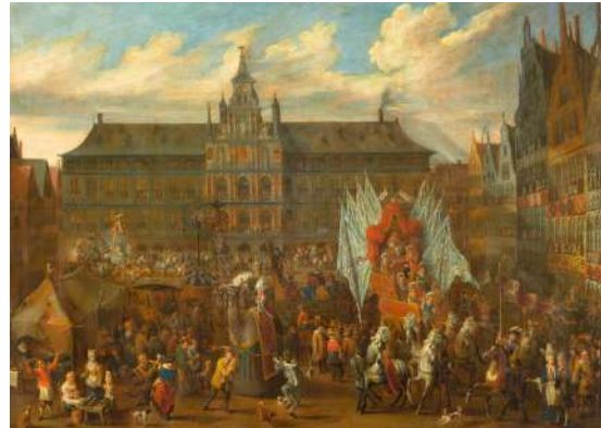
Alexander van Bredael Cortège à Anvers Lille, Musée de l'Hospice Comtesse