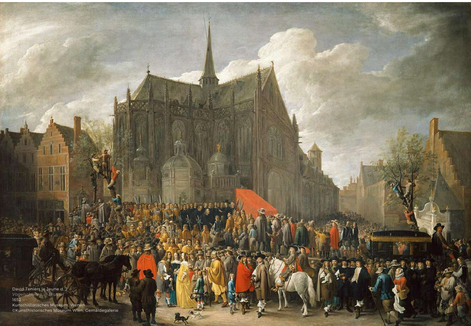
David Teniers le Jeune d. J. Vogelschieten in Brussel 1652 Kunsthistorisches Museum, Wien