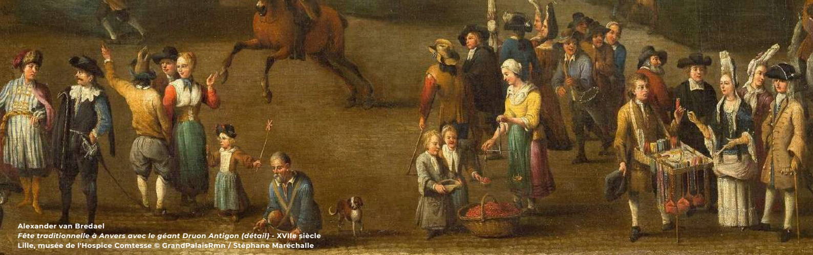
Alexander van Bredael Fête traditionnelle à Anvers avec le géant Druon Antigon (détail) - XVIIe siècle Lille, musée de l'Hospice Comtesse