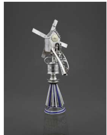
Gobelet à surprise , appelé aussi gobelet à moulin Lille, Musée de l'Hospice Comtesse