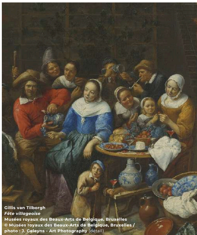
Gillis van Tilborgh Fête villageoise Musées royaux des Beaux-Arts de Belgique, Bruxelles (détail)

Deze feesten palmde de publieke ruimte in en waren ook de belichaming van een mentaliteit, van een levensfilosofie zelfs die ook vandaag nog leeft in het volledige cultuurgebied van de vroegere Nederlanden, waar nog altijd kermissen, volksfeesten en optochten