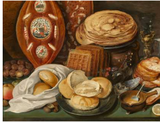
Hans Francken Nature morte aux crêpes, gaufres et Vollaert Musées royaux des Beaux-Arts de Belgique, Bruxelles