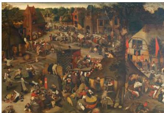
Pierre Bruegel le Jeune (ou atelier de) Kermesse avec théâtre et procession Musées royaux des Beaux-Arts de Belgique, Bruxelles