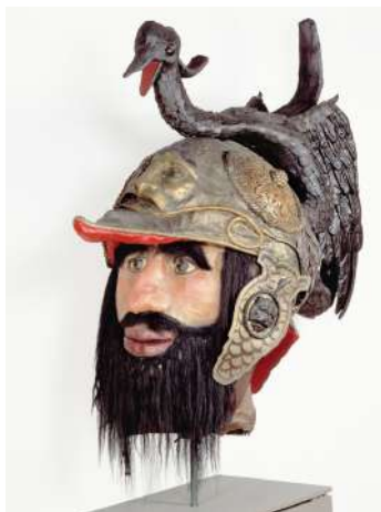
Pieter Coecke van Aelst Museum aan de Stroom (MAS) Tête du géant Druon Antigone 1534-1535 VM.2004.1021.00*, Collection Ville d'Anvers - MAS